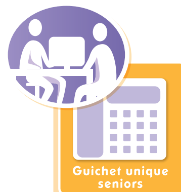
Guichet unique seniors

• Du lundi au vendredi de 8 h 30 à 12 heures et de 13 à 17 heures. Tél. : 02 32 95 83 94.