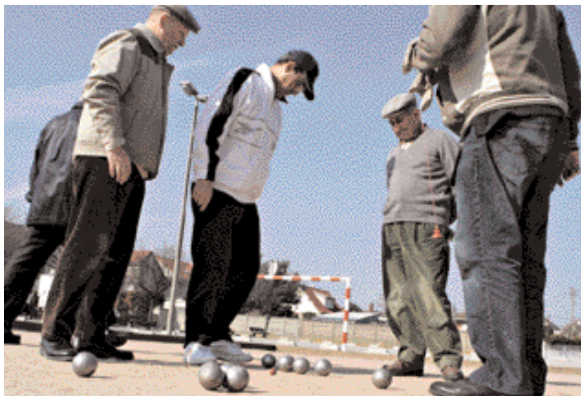
Place Blériot, les boulistes sont là pour s'amuser... mais avec sérieux.

sion tranquille place Louis-Blériot, à deux pas du Château Blanc. Sur ce terrain, se côtoient des licenciés du club Madrillet pétanque et des amateurs. Plusieurs dizaines se retrouvent chaque jour. Beaucoup ont hérité d'un surnom affectueux. : Monsieur le maire, la Balance, la Pendule et même un certain Roi de la