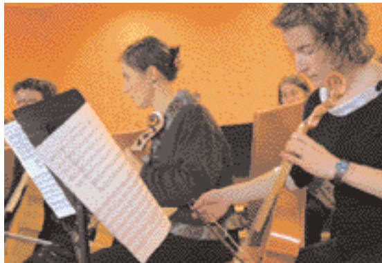
Les élèves des classes de musique ancienne en concert.