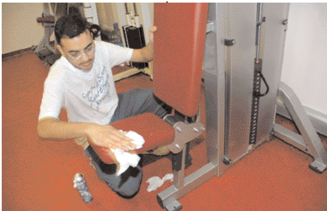
Au service des sports, trente-huit agents assurent l'encadrement des sportifs mais aussi l'entretien des installations.

AL : Les municipalités ont été au cœur du développement du sport (en finançant les équipements, en les