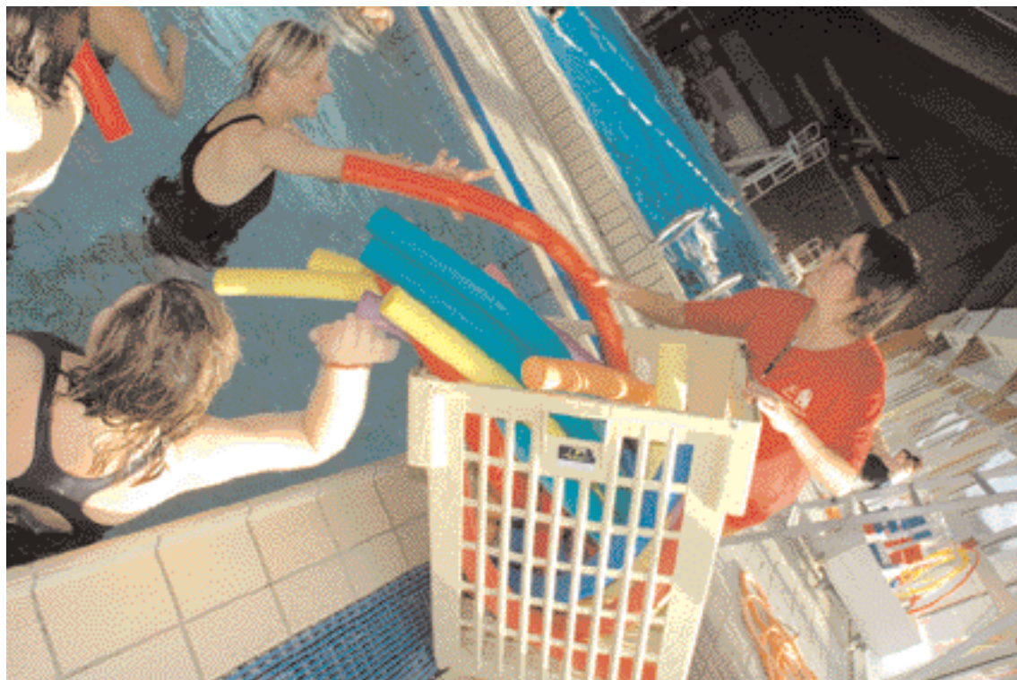
La piscine accueillera prochainement un lieu d'information sur le sport, le corps et la santé.