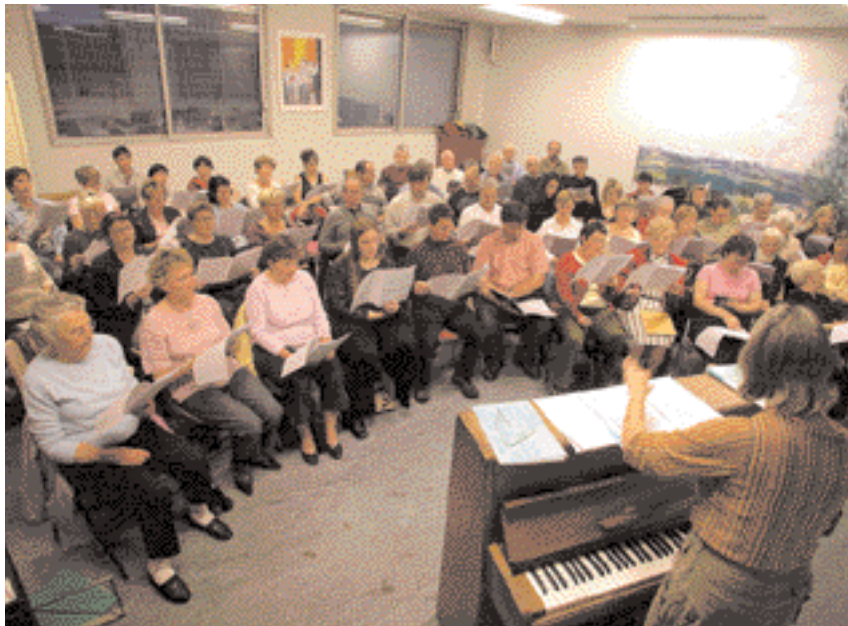
La nouvelle école de musique comportera notamment une grande salle de répétition de 100m 2 .

Le projet de nouvelle école de musique entre dans sa phase active avec le lancement des appels d'offres puis l'ouverture du chantier dans les prochains mois.