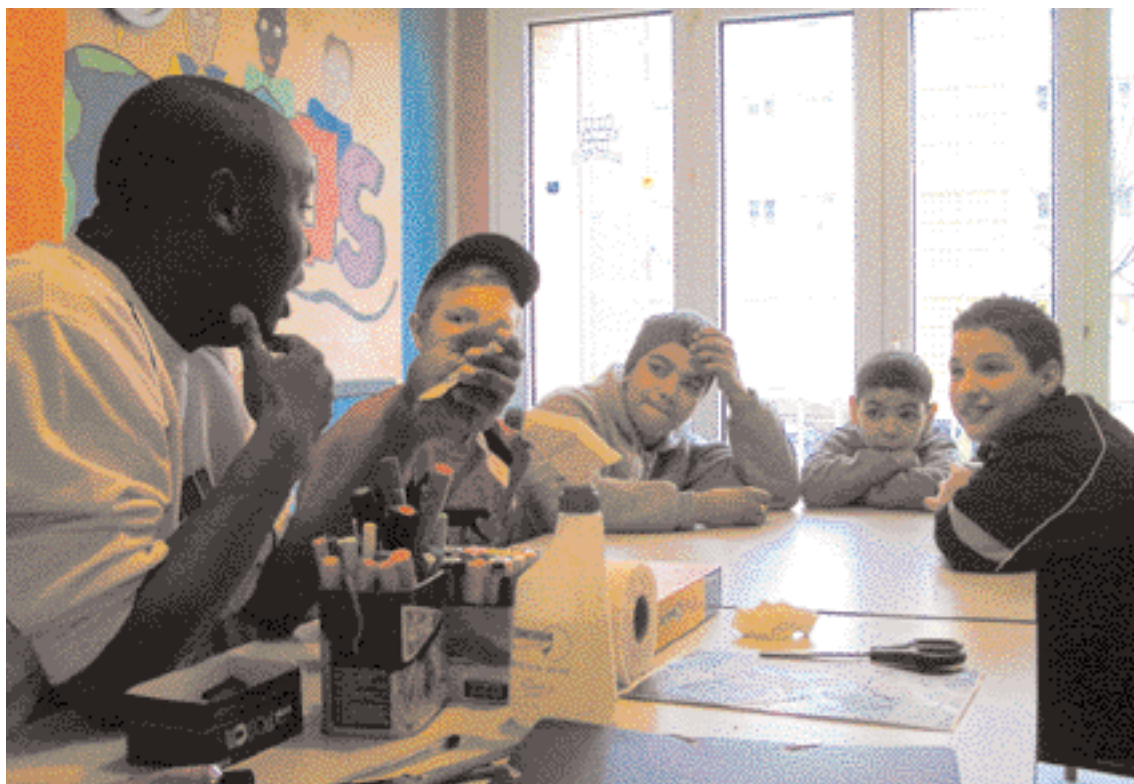
Partie de cartes au Local ados animé par le service enfance sur le quartier. La future ludothèque sera destinée aux 12/25 ans, mais aussi aux parents.

Dans la foulée du renouvellement urbain d'Hartmann, un nouvel équipement municipal verra le jour fin 2007 avec ludothèque et centre socioculturel.