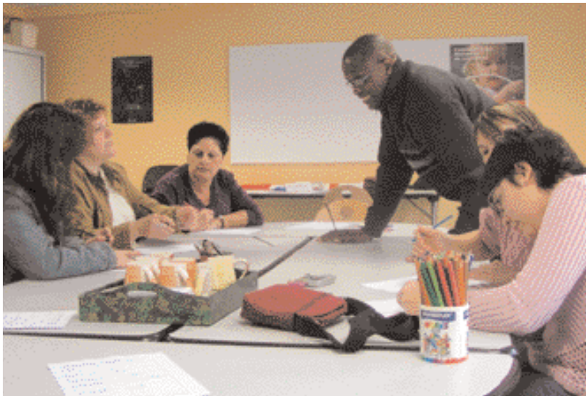
Une réunion d'information avec la Caf sur les droits et devoirs des locataires.