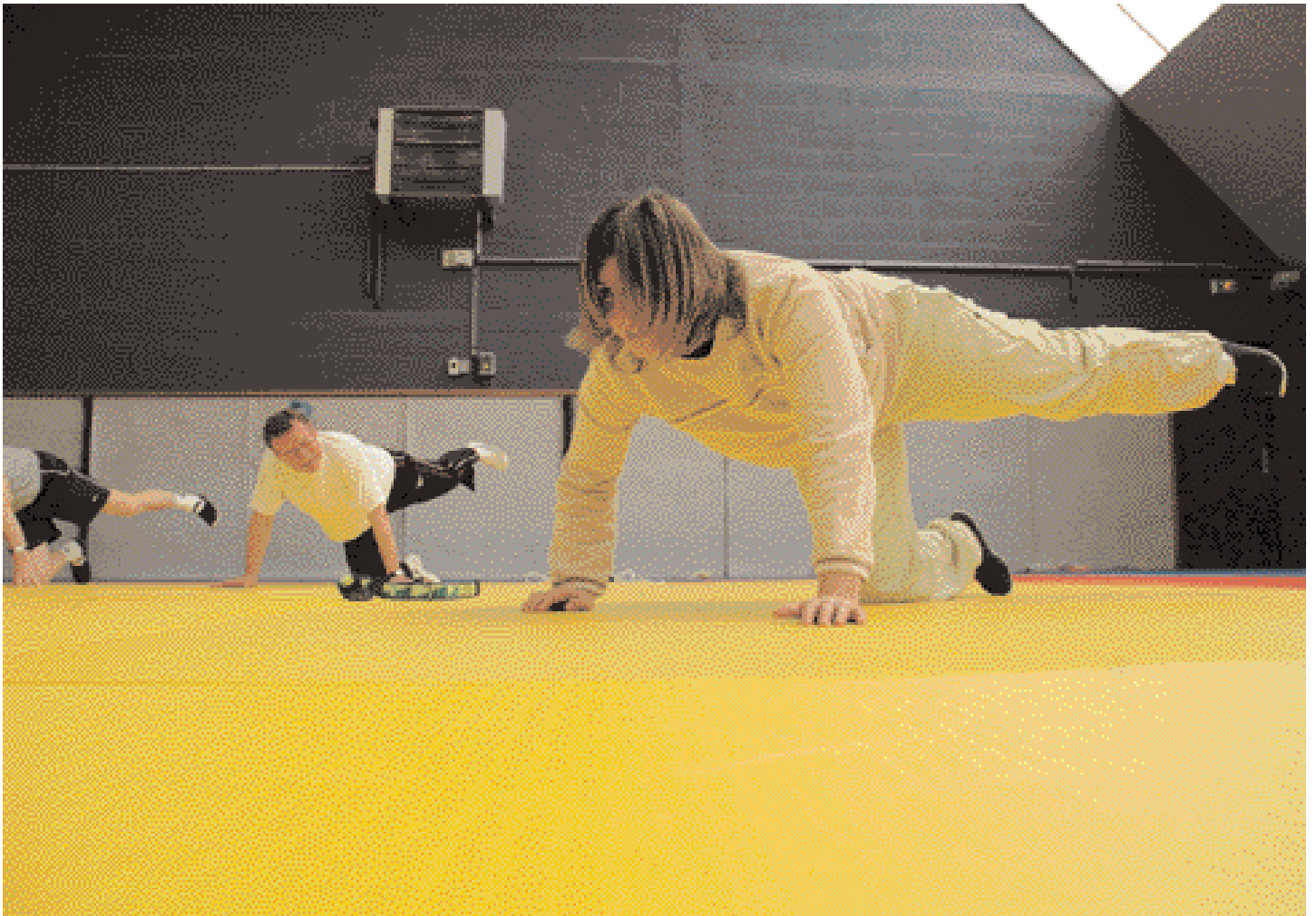
La pratique du sport change : les femmes et les seniors sont de plus en plus nombreux à fréquenter les structures.

fre et des installations, qui tournent à plein régime », précise Hervé Réaux, directeur du service des sports. Par exemple, les dysfonctionnements signalés par les premiers baigneurs de la piscine ont été notés et sont en passe d'être résolus.