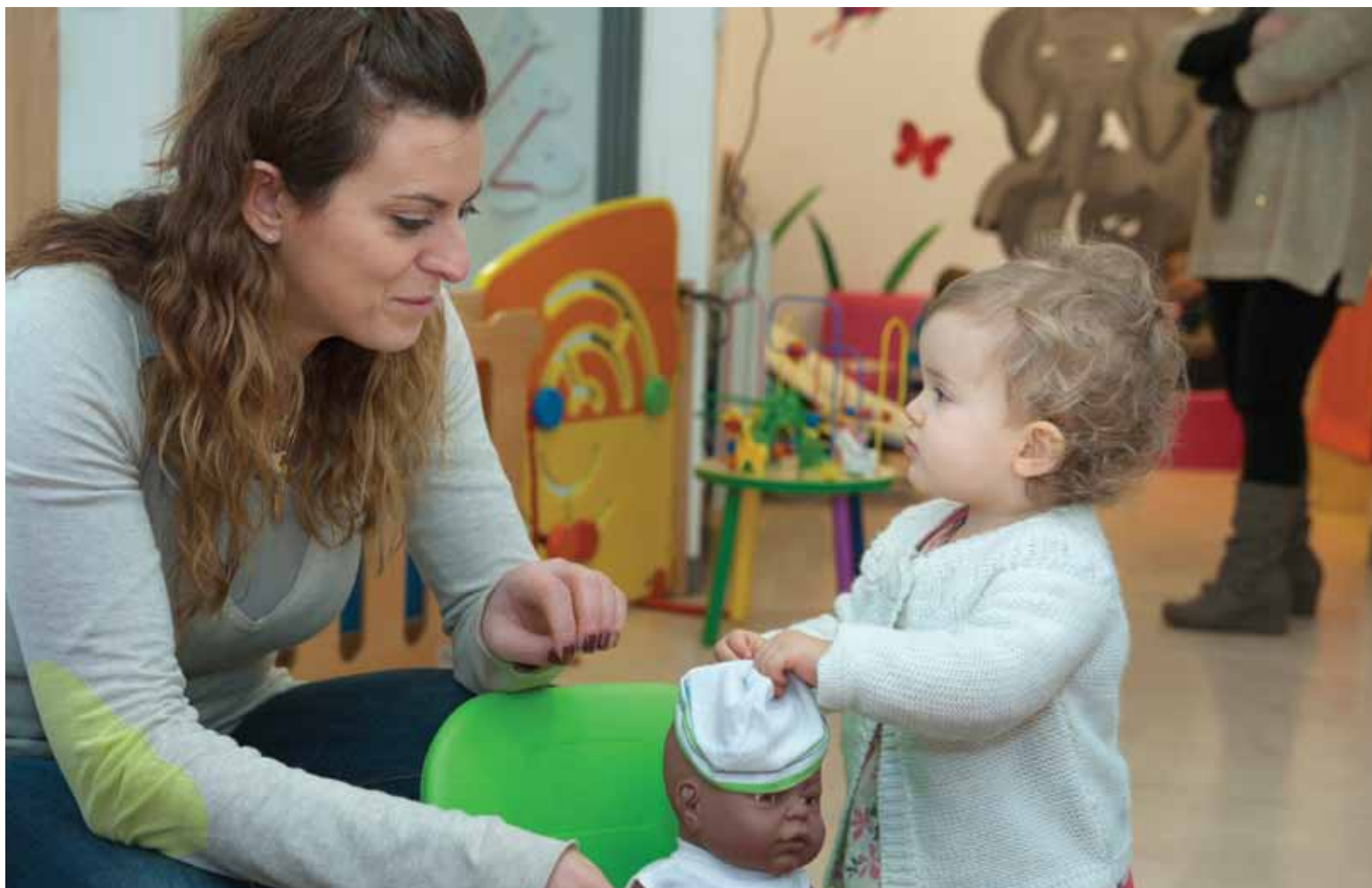
Petite enfance : la Caf verse des prestations aux familles et finance des services et des équipements comme les crèches.

La modulation des allocations familiales devrait représenter une « économie » de 800 millions par an pour les caisses de la branche famille de la Sécurité sociale. Une somme qui ne compensera toutefois pas les allègements des cotisations famille octroyés aux entreprises dans le cadre du « pacte de responsabilité et de solidarité ». Qui financera les « allocs » ?