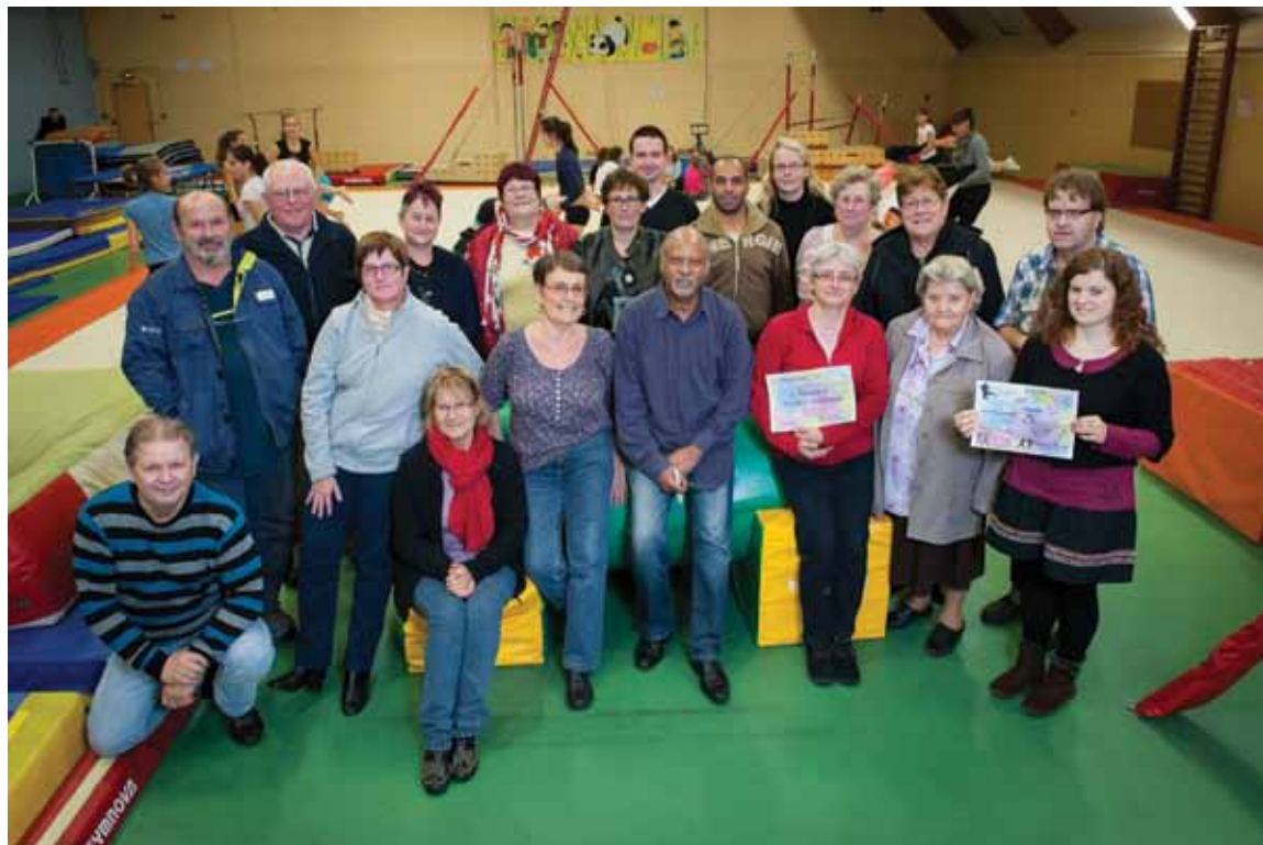
Pour cette édition 2014 du Téléthon, le collectif Solidarité espoir recherche souhaite battre le record de dons de 5 461 € de l'année dernière.

Dès vendredi 5 décembre, rendez-vous au gymnase de l'Insa pour deux tournois de foot en salle avec l'Amicale sportive madrillet Château blanc (ASMCB). Le premier aura lieu à 18 heures pour les 13/16 ans, le second à 20 heures pour les 17 ans et plus. Le même jour, dès 17 h 45, celles et ceux qui ont des fourmis dans les jambes pourront tenter l'expérience de plus en plus prisée d'une randonnée nocturne au départ de