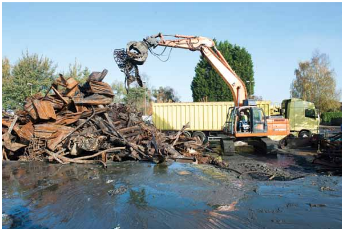
Si les délais sont tenus, les salariés de l'entreprise Copak pourraient retrouver une usine toute neuve dès juillet 2015.