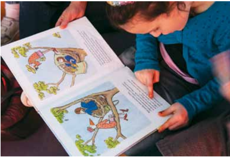
Enfance et jeunesse : la Caf aide au financement des Animalins et à la pratique sportive des jeunes.