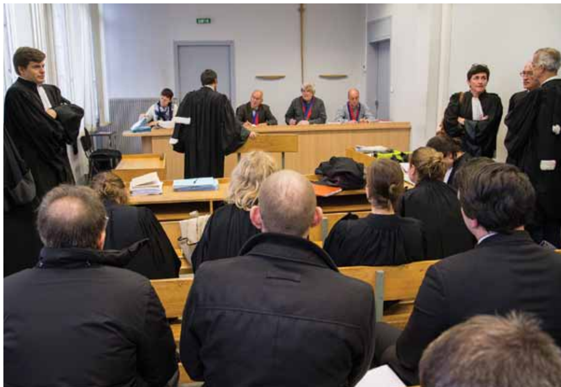
Deux conseillers « employeurs » et deux conseillers « salariés » jugent les affaires. S'ils ne peuvent se départager, s'adjoint ultérieurement à eux un magistrat professionnel, le juge départiteur. À Rouen, seulement 15 % des affaires sont ainsi renvoyées.

« Les prud'hommes sont une des rares juridictions qui reste humaine et à l'écoute des faits », plaide l'avocate. « Ils n'ont ni les moyens ni les juges professionnels pour mettre en œuvre cette réforme. » Personne, au final, ne sortira gagnant de cette affaire... ♦