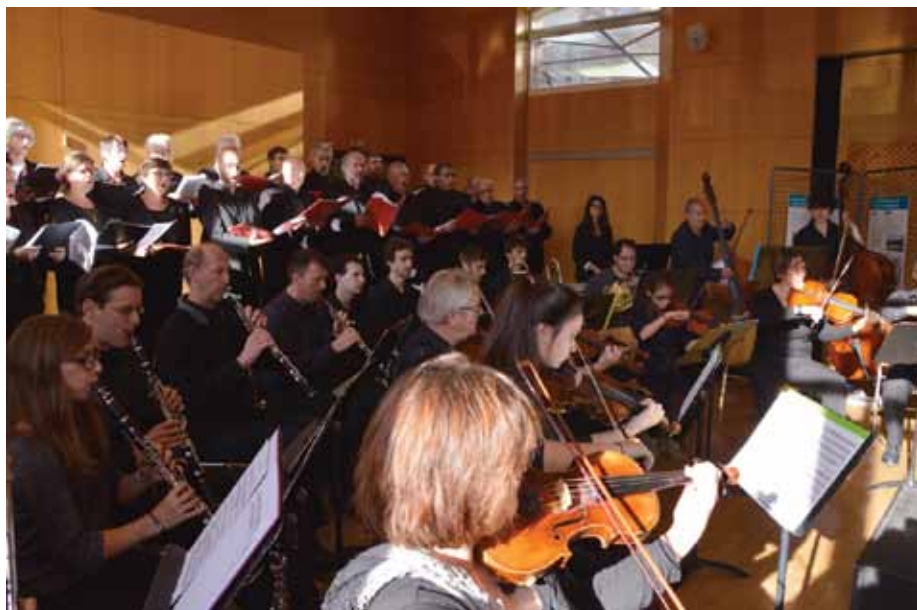
Le 11 novembre, l'orchestre symphonique du conservatoire stéphanois et l'ensemble vocal Oriana ont interprété Va, pensiero de Verdi et Au nom des enfants sur un thème de Dvořák.