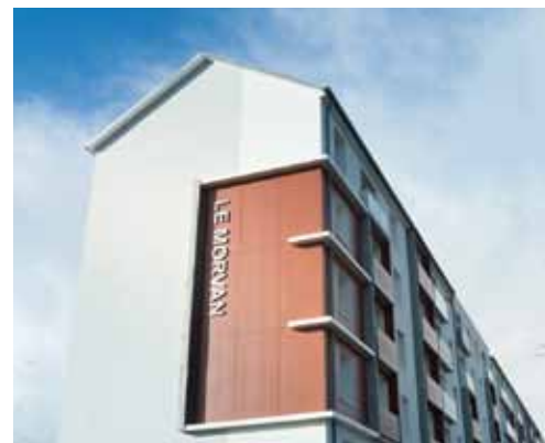
Dans ce scrutin, chaque logement vaut une voix.

Logirep, entre le 14 novembre et le 3 décembre ; pour ICF, entre le 26 novembre et 9 décembre. Pour ce scrutin qui a lieu tous les quatre ans, chaque logement compte pour une voix quel que soit le nombre de ses occupants (le titulaire du bail est l'électeur à condition d'être majeur et d'occuper le logement depuis au moins six semaines avant le début de l'élection). En 2010, date du précédent scrutin, seuls 20 % des inscrits se sont exprimés. Le matériel de vote est envoyé par La Poste à chaque électeur. Le vote a lieu par correspondance (le cachet de La Poste faisant foi) ou par internet. ♦