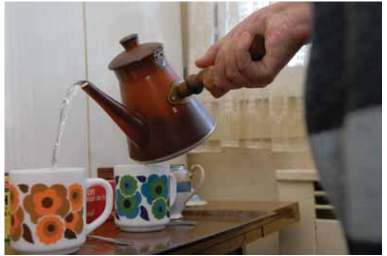
Logement et cadre de vie : versées sous conditions de ressources, les aides de la Caf permettent de payer le loyer ou de rembourser un prêt immobilier pour les plus modestes.